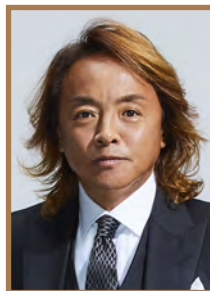
解説 北澤 豪 (フジパンCUPアンバサダー)

KBC 九州朝日放送 NCC 長崎文化放送 KAB 熊本朝日放送 OAB 大分朝日放送 UMK テレビ宮崎 KKB 鹿児島放送 QAB 琉球朝日放送 にて放送。