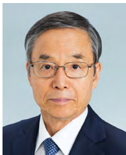
フジパングループ 本社株式会社 代表取締役社長