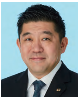
(一社)鹿児島県サッカー協会 会長

「九州は一つ」を合い言葉に、今大会の成功をお祈りいたしまして、挨拶といたします。