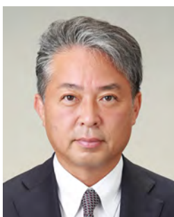
九州朝日放送株式会社 代表取締役社長

最後になりますが、毎年本大会開催に変わらぬご尽力を頂いております九州サッカー協会ならびに関係者各位に、改めて厚く御礼申し上げます。