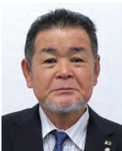
(一社)九州サッカー協会 会長